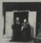
Молодцы, выходящие в школу. М. Дмитриев.