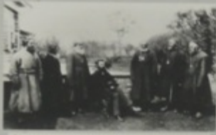
Взрослые студенты с женской школьницей. М. Дмитриев.