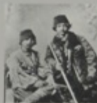
Телеграфисты. М. Дмитриев.