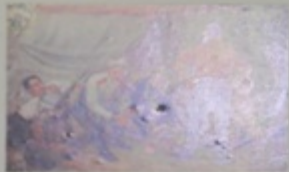
К. Г. Савицкий, «Лето на Дону» 1951 г.