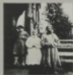
Школьники в школьном дворе. 1946 г. М. Дмитриев.