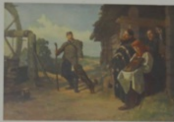
И. В. Яковлев, «Торжественное собрание на Родном» 1947 г.