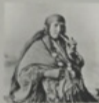
Суданка. М. Дмитриев.